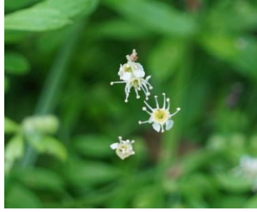
散ったイヌザクラの花が蜘蛛の巣で