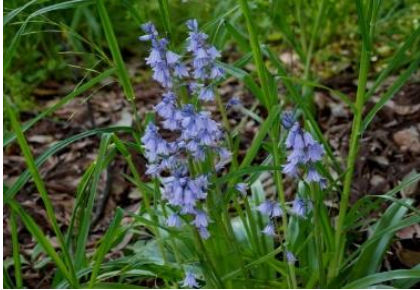
観賞用に改良された ヒヤシンスイデス(植栽)