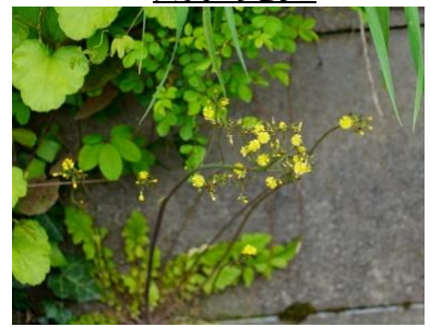
アカオニタビラコ