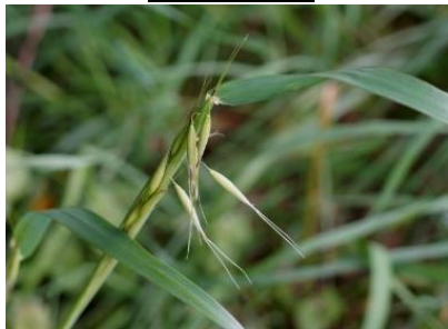
スズメノチャヒキ