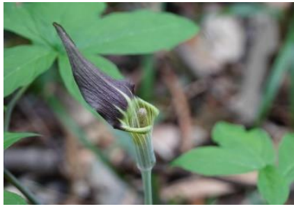
トウゴクマムシグサ