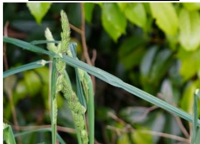
カモガヤ（オーチャードグラス）牧草