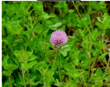
ムラサキツメクサ