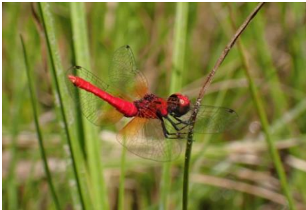
ハッチョウトンボ 日本で最小のトンボ