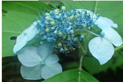
ヤマアジサイ 野生種