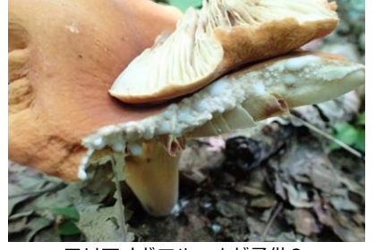
チチタケ 傷つけると乳のような汁がでる