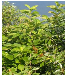
ハゼノキ 暖地性植物、自生ではない