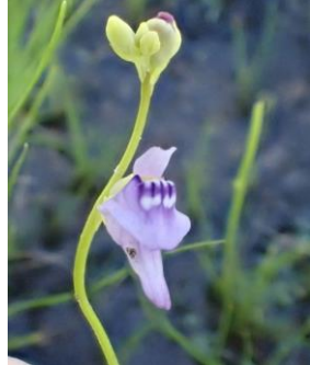
ホザキノミミカキグサ 地中の小動物を捕食