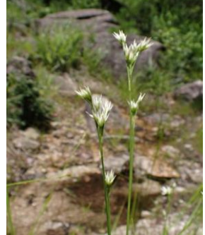
ミカズキグサ 氷河期の生き残り